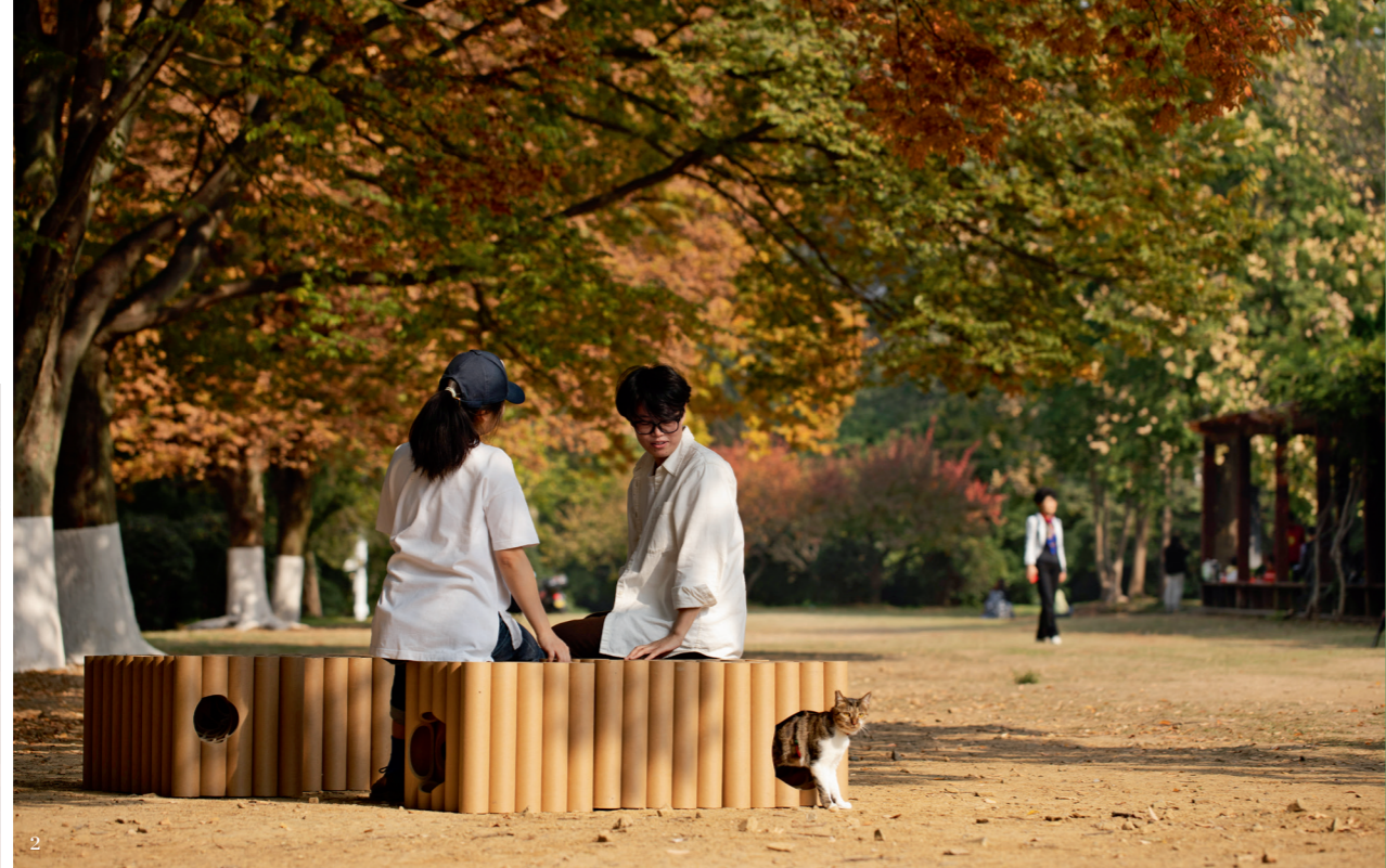
1. 参展作品《猫洞》(林琳), 作品用城市中最常见的两种建筑材料: PVC 管道和阳光板, 构成的单元模块, 能起到保温和保护作用, 能随具体空间环境做出调整, 为流浪猫提供居所, 也在城市空间呈现公共与标志性。(© UABB 摄影: 胡康榆) 2. 南京反几建筑设计事务所作品《共栖》(摄影: LOG 对数摄影工作室) 设计师利用印刷厂废弃的纸筒做的模块化装置, 内部有通道, 可以为人和动物提供休息空间。3. 参展作品《猫邻居》靳远(多重建筑), 材料乘以设计, 设计师对猫咪行为的假想, 比如从窄口进入, 获得宽阔视野; 躲进阁楼获得安全感; 守候在天井以窥探邻居……(© UABB 摄影: 胡康榆)